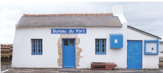
Mon bureau à Damgan pour me dédouaner

La santé est souvent prétexte à l'éloignement des villes et donne à nouveau naissance à la pratique antique du thermalisme , reconnues par l'Académie de Médecine et pris en charge par la Sécurité Sociale dès 1950... Autour de ces infrastructures thermales fleurissent les luxueux complexes hôteliers ou les somptueuses villas des riches villégiateurs , donnant lieu à la création d'un important patrimoine architectural particulièrement développé au cours des XIX e et XX e siècles, répertorié par les services de l'inventaire du patrimoine culturel. J'ai perdu les eaux il y a très longtemps, en vain, spiritus vitalis, et depuis suis en dérangement pour vous, toute l'année... (voir photos ci dessous)