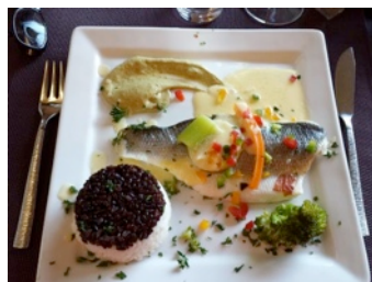
Filet de bar en papillotes